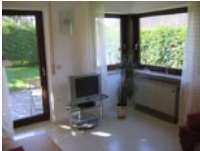
Fernseher mit SAT-Anschluß