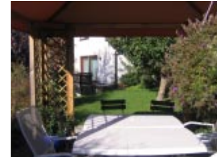
Blick durch den Pavillon auf unser Haus