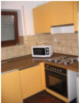
Komplett eingerrichtete Küche